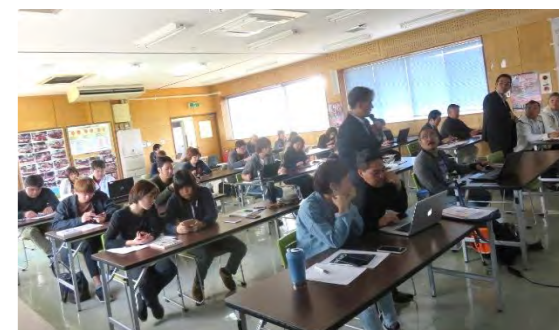
▲ 28名の受講。スマホやPCで登録中の皆様