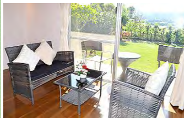
▲日当たりの良いリビング

敷地内にある「Bistro&cafe 味熟者」ではとても美味しい夕食や朝食を用意しております。ご家族やお友達とぜひ一度、泊まりにきてください。