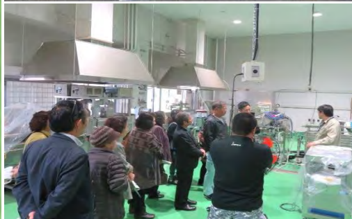
▲沖縄県工業技術センターの工場見学