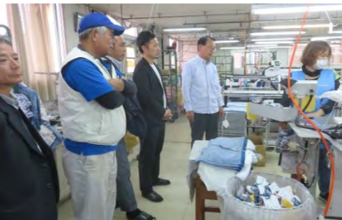
▲パイプニット(株)かりゆしウエア工場見学