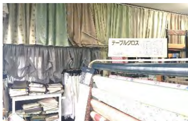
▲オーダーカーテンも承ります！