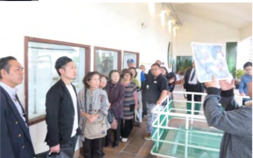
▲沖縄の海塩ぬちまーすの施設見学